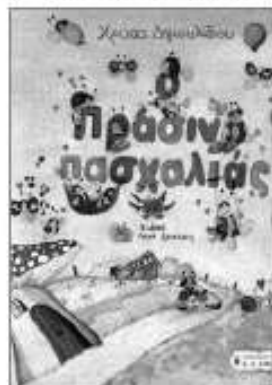
«Πρασινονασχαλιάς» Χρύσα Δημουλίδου εκδ. Λιβάνης