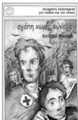
«Αγάπη χωρίς σύνορα» Κατερίνα Μουρίκη εκδ. Πατάκη