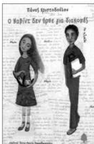
«Ο Ναβίντ δεν ήρθε για διακοπές» Πάνος Χριστοδούλου εκδ. Κέδρος