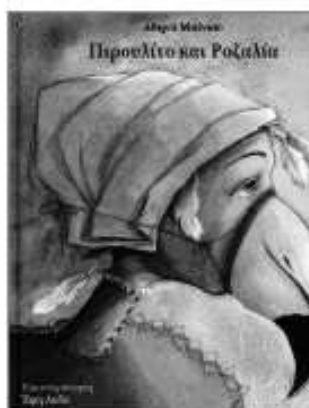
«Πιρουλίνο και Ροζαλία» Αθηνά Μπίνιου εκδ. Πατάκη