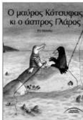
«Μαύρος Κότσουφας και άσπρος Γλάρος» Κίτυ Κρούθερ, εκδ. Σύγχρονοι Ορίζοντες