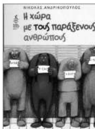
«Η χώρα με τους παράξενους ανθρώπους» Νικόλας Ανδρικόπουλος εκδ. Καλέντης