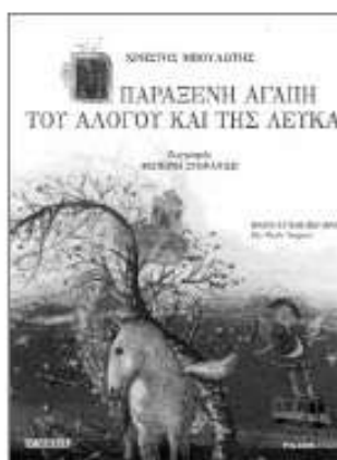
«Η παράξενη αγάπη του αλόγου και της λεύκας» Χρήστος Μπουλιώτης εκδ. POLARIS