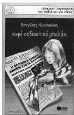
«Καφέ αφηιστικό μπαλάκι» Baγγέλης Ηλιόπουλος εκδ. Πατάκη