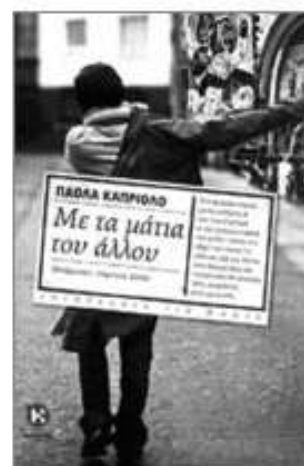
«Με τα μάτια του άλλου» Πάουλα Καπριόλο Εκδ. Καλέντης