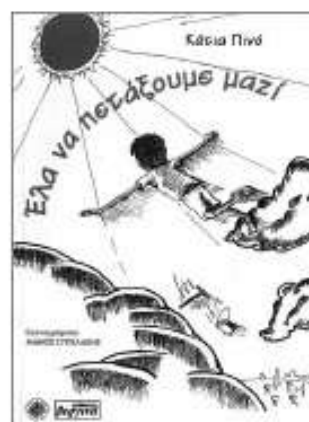
«Ελα να πετάξουμε μαζί» Κάτια Πινό εκδ. Βεργίνα