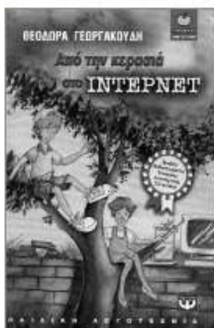
«Από την κερασιά στο ίντερνετ» Theodora Γεωργακούδη εκδ. Ψυχογιός