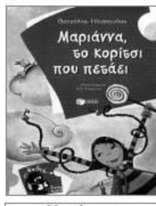
«Μαριάννα, το κορίτσι που πετάει» Βαγγέλης Ηλιόπουλος εκδ. Πατάκη