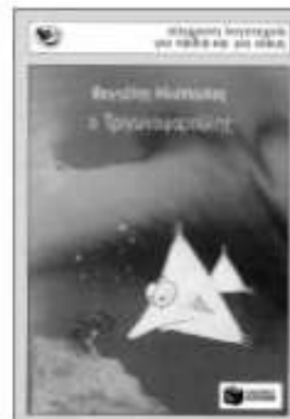
«Ο Τριγωνοφαρούλης» Βαγγέλης Ηλιόπουλος εκδ. Πατάκη