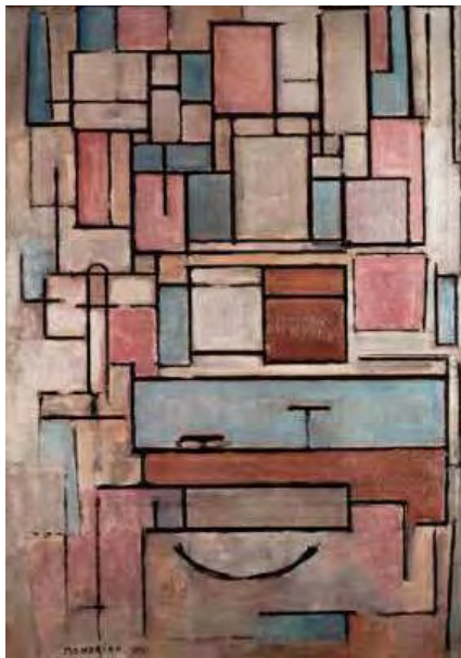
Εικόνα 7.1 Piet Mondrian. Composition with Color Areas. 36

Ο Von Glasersfeld πρότεινε τρεις ουσιαστικές επιστημολογικές αρχές του εποικοδομισμού στις οποίες μια τέταρτη έχει προστεθεί λαμβάνοντας υπόψη τις πρόσφατες γραφές.