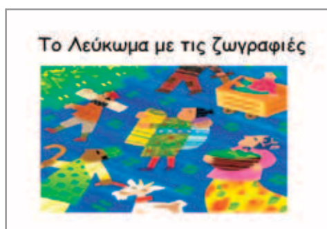
Εικόνα 5: Φύλλο εργασίας 3, «Το Λεύκωμα με τις ζωγραφιές μου»

Η κάθε ομάδα μπορεί να εκφράσει με ζωγραφιές τα συναισθήματα που προκαλεί η ενασχόληση με το θέμα/ πρόβλημα και να δημιουργήσει ένα ηλεκτρονικό «λεύκωμα με ζωγραφιές» με το Λογισμικό Παρουσίασης . Ο εκπαιδευτικός Πληροφορικής μπορεί να βοηθήσει την κάθε ομάδα να χρησιμοποιήσει απλά βοηθήματα ζωγραφικής του Office, ή κάποια άλλο Σχεδιαστικό πρόγραμμα ή Πρόγραμμα επεξεργασίας εικόνων . Τα παιδιά μπορούν να αξιοποιήσουν το ημιδομημένο Φύλλο εργασίας 3 (εικόνα 5) και στη συνέχεια να το στείλουν για συμπλήρωση στο συνεργαζόμενο σχολείο μέσω του Ηλεκτρονικού Ταχυδρομείου .