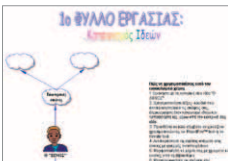
Εικόνα 1: Φύλλο εργασίας 1, «Καταιγισμός ιδεών»

Τα παιδιά συμπληρώνουν στη συνέχεια το Φύλλο εργασίας 1 (εικόνα 1). Η συμπλήρωσή του θα ήταν καλό να γίνει σε εργασία στον υπολογιστή με την αξιοποίηση του Επεξεργαστή Κειμένου . Οι λειτουργίες του λογισμικού γενικής χρήσης εξηγούνται στους μαθητές όταν τις χρειάζονται κατά τη συγγραφή.