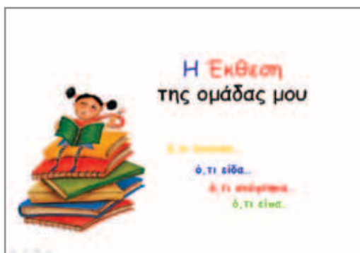
Εικόνα 6: «Η οπτικοακουστική έκθεση της ομάδας μου»

Ο εκπαιδευτικός της τάξης μπορεί να βοηθήσει την όλη ομαδική εργασία. Η απαγγελία ποιημάτων από τους μαθητές (με ηχογράφηση), η ανάλογη μουσική σύνθεση της αρεσκείας των παιδιών από την προτεινόμενη δισκογραφία, σχετικά έργα τέχνης Ελλήνων και ξένων λογοτεχνών, φωτογραφίες που θα έχουν βρει τα παιδιά στο Διαδίκτυο, προσωπικά κείμενα, κείμενα λογοτεχνών, εννοιολογικοί χάρτες κ.λπ. αποτελούν τα στοιχεία της ψηφιακής παρουσίασης (εικόνα 6).