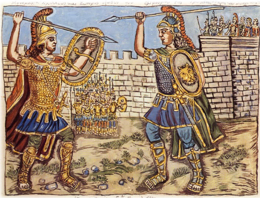
Μονομαχία Αχιλλέα και Έκτορος έξωθεν του φρουρίου της Τρωάδας. Ο Πάρης και η οικογένεια του, Θεόφιλος (1870-1934)

Ένας ήρωας δεν μπορεί να τρέχει μπροστά στον αντίπαλο. Ο θεός μερικές φορές βοηθά τους ανθρώπους να δουν τις υποχρεώσεις τους και τη μοίρα τους. Ο Έκτορας είναι σαν να ζει σε ένα όνειρο (θυμηθείτε την προηγούμενη παρομοίωση). Βιώνει την απελπισία της μοναξιάς του πολεμιστή στο πεδίο της μάχης. Βλέπει κι ακούει αυτό που θα ήθελε να ακούσει και να δει. Είναι ενδιαφέρον ότι δικαιολογεί ο ίδιος την παρουσία του Δηϊφωβου έξω από τα τείχη, όπως μέσα σε ένα όνειρο δικαιολογούμε ή δεν αναρωτιόμαστε και για τις πιο παράλογες καταστάσεις που εμφανίζονται. Επιπλέον, ο Έκτορας είναι καταδικασμένος 12 και ολοφάνερα κατώτερος από τον Αχιλλέα. Η αδυναμία του να σταθεί απέναντί του στην προηγούμενη σκηνή το καταδεικνύει. Η επιστροφή του δόρατος δεν επηρεάζει την έκβαση της μονομαχίας αλλά τον τρόπο θανάτου του Έκτορα. Ο Αχιλλέας παίρνει τη βοήθεια της θεάς, ακριβώς επειδή δεν τη χρειάζεται. Οι αρχαίοι πίστευαν ότι μια στιγμή επιτυχίας συντελούνταν πάντοτε με τη βοήθεια ενός θεού. Η βοήθεια της Αθηνάς δεν περιορίζει τη δόξα του Αχιλλέα· αντιθέτως, την αυξάνει. Εν πάση περιπτώσει, όμως, η σκηνή αυτή καταδεικνύει και τη διαφορά στο ήθος των θεών της Ιλιάδας 13 συγκριτικά με την Οδύσσεια . Στην Ιλιάδα οι θεοί ζυγίζουν ψυχές και κήρες. Στην Οδύσσεια απονέμουν δικαιοσύνη και μάλιστα με τον λιγότερο δυνατό παρεμβατισμό.