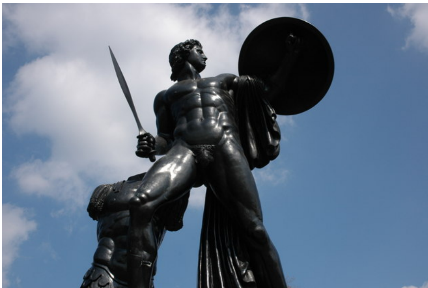
Αχιλλέας, Sir Richard Westmacott (1822), άγαλμα στο Hyde Park του Λονδίνου

Η ραψωδία Χ χαρακτηρίζεται από αξιοσημείωτη ισορροπία και προσεκτική οργάνωση, ενώ υπάρχουν πολλοί συσχετισμοί και αναφορές σε ραψωδίες που προηγούνται και έπονται. Έτσι στην αρχή της ραψωδίας συναντούμε τον Έκτορα να έχει μείνει έξω από τα τείχη της Τροίας, στις Σκαιές Πύλες (ποτέ πριν οι πύλες αυτές δεν δικαιολόγησαν περισσότερο το δυσσιώνο όνομά τους. Σκαιές = Δυτικές, αλλά και «δυσσιώνες»), την ώρα που ο υπόλοιπος στρατός και ο λαός της Τροίας έχει καταφύγει στην πόλη, για να αποφύγει την εκδικητική μανία του Αχιλλέα. Είναι χαρακτηριστική η χρήση του ρήματος εἶλω-εἴλωμαι για την πράξη αυτή (στριμώχνω, τσουβαλιάζω, στοιβάζω σαν σαρδέλες). Στην αρχή της ραψωδίας υπάρχουν τρεις λόγοι: του Πριάμου και της Εκάβης 3 , οι οποίοι προσπαθούν απεγνωσμένα να πείσουν τον Έκτορα 4 να μπει στην πόλη και ο μονόλογος του Έκτορα με τον οποίο αιτιολογεί την επιλογή του να παραμείνει έξω από τα τείχη, εξετάζοντας παράλληλα υποτιθέμενες εναλλακτικές επιλογές. Στο τέλος της ραψωδίας υπάρχουν και πάλι τρεις θρήνοι, του Πριάμου, της Εκάβης και της Ανδρομάχης για το νεκρό πια Έκτορα. Στο κέντρο της ραψωδίας έχει τοποθετηθεί το κορυφαίο γεγονός, η μονομαχία Αχιλλέα-Έκτορα. Πρόκειται για μια ραψωδία έντονου πάθους και έντονης κινητικότητας σωμάτων και ψυχών. Ουσιαστικά αποτελεί το αποκορύφωμα της πολεμικής δράσης της Ιλιάδας , καθώς η ραψωδία αυτή σηματοδοτεί με τον τρόπο της και το τέλος του πολέμου.