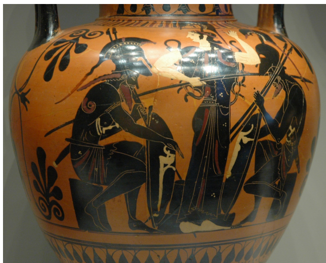
Ο Αχιλλέας και ο Αίας παίζουν πεσσούς, Αττικός μελανόμορφος αμφορέας (510 π.Χ.)

Η ραψωδία Χ περιλαμβάνει την κορύφωση της μῆνις του Αχιλλέως, η οποία μετά τον θάνατο του Πατρόκλου (Π) έχει διαφοροποιηθεί: στόχος της δεν είναι πια το πρόσωπο του Αγαμέμνονα αλλά του Έκτορα. Ενώ η μῆνις προς τον Αγαμέμνονα οδήγησε τον Αχιλλέα σε μια παθητική στάση, η μῆνις προς το πρόσωπο του Έκτορα παίρνει τη μορφή της αναζήτησης εκδίκησης. Περιλαμβάνει επίσης τη μονομαχία των δύο κορυφαίων ηρώων, Αχιλλέα και Έκτορα, προς την οποία συγκλίνει όλο το ποίημα 2 . Από τη ραψωδία έχουν επιλεγεί να διδαχτούν οι στίχοι 131-404, στους οποίους περιέχονται η καταδίωξη του Έκτορα από τον Αχιλλέα, η διαβούλευση των θεών για την τύχη του Έκτορα, η ψυχοστασία, η μονομαχία των δύο ηρώων και η κακοποίηση του σώματος του Έκτορα από το στράτευμα των Αχαιών και ιδιαίτερα από τον Αχιλλέα. Ουσιαστικά στους προτεινόμενους στίχους περιλαμβάνονται δύο στάδια, η καταδίωξη του Έκτορα (131-246) και η μονομαχία (247-404). Οι δύο αυτές υποενότητες μπορούν να αποτελέσουν το αντικείμενο διδασκαλίας για τις διδακτικές περιόδους που προβλέπονται.