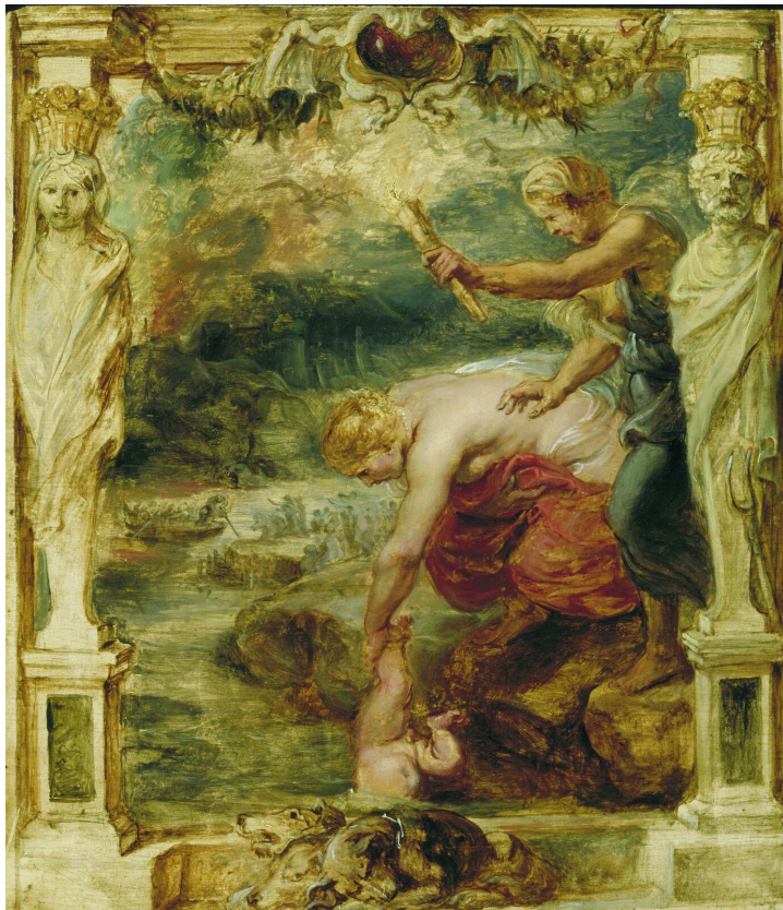
Η Θέτιδα βυθίζει τον Αχιλλέα στα νερά της Στύγας, Peter Paul Rubens (1577-1640)

Η ραψωδία Χ κορυφώνει τη δράση της Ιλιάδας με τη μοιραία σύγκρουση ανάμεσα στον βασικό υπερασπιστή της Τροίας, τον Έκτορα και τον σπουδαιότερο πολεμιστή των Αχαιών, τον Αχιλλέα. Μοιραία όχι μόνο για τον Έκτορα, ο οποίος θα βρει τον θάνατο στα χέρια του Αχιλλέα, αλλά και για τον ίδιο τον Αχιλλέα, του οποίου ο θάνατος, όπως γνωρίζουμε εμείς αλλά και ο ίδιος, θα ακολουθήσει αυτόν του αντιπάλου του. Πρόκειται για τις δύο κορυφαίες φυσιογνωμίες του έργου, των οποίων η μοίρα διαπλέκεται και