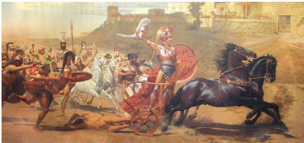
Ο θριαμβευτής Αχιλλέας Αχιλλειον, Κέρκυρα

τρόπος που το κάνουν μπορεί να έχει κάτι το τελετουργικό, δείχνει όμως και τη μικρότητά τους. Αυτοί που έφευγαν από μπροστά του στο πεδίο της μάχης τον πλησιάζουν τώρα που είναι νεκρός, για να τον εκδικηθούν και να βεβαιωθούν για το θάνατό του. Η περιγραφή της πράξης τους σε συνδυασμό με τον θαυμασμό τους για την ομορφιά του νεκρού εξυψώνουν το μεγαλείο του Έκτορα. Μειώνει επίσης αυτούς που προβαίνουν σε αυτήν την πράξη και συμπεριφέρονται με τον τρόπο που συνηθίζει να συμπεριφέρεται ο όχλος.