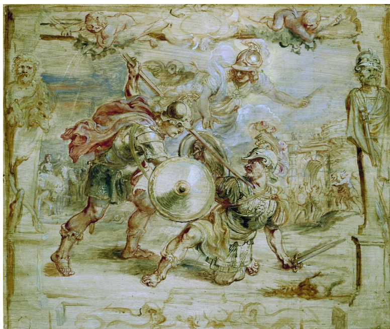
Ο θάνατος του Έκτορα, Peter Paul Rubens (1577-1640)

οποία ο πρώτος προσπαθεί μάταια να δεσμεύσει τον αντίπαλό του να σεβαστεί το σώμα του. Η απάντηση του Αχιλλέα είναι ενδεικτική του πάθους του και της σκληρότητάς του. Όπως τα λιοντάρια δεν συνομολογούν με τους ανθρώπους, όπως οι λύκοι με τα πρόβατα, αντίστοιχο είναι και το μίσος του Αχιλλέα. Οι φυσιολογικές κοινωνικές συμβάσεις δεν ισχύουν για τον Έκτορα. Εξ ου και η φυγή του μπροστά σε ένα τέτοιο θηρίο ΔΕΝ είναι αντιηρωική. Ο κόσμος των ζώων, εν αντιθέσει με τον κόσμο των ανθρώπων, είναι ένας κόσμος από τον οποίο απουσιάζει η δικαιοσύνη (ΗΣίοδος, Έργα 276-80). Εντούτοις, η μονομαχία εξελίσσεται πολύ γρήγορα, με την παρέμβαση μάλιστα ενός θεού, την ώρα που θα ανέμενε κάποιος μια πιο εντυπωσιακή και μεγαλύτερη σε διάρκεια σύγκρουση, ανάλογη με αυτή του Έκτορα με τον Αίαντα στην Η (244-272) 14 . Πέρα από την ταχύτητα της εξέλιξής της, αυτό που την ξεχωρίζει από προηγούμενες μονομαχίες είναι ότι στη διάρκειά της είμαστε ενήμεροι για τις αντιδράσεις και τα συναισθήματα των πρωταγωνιστών, για τα θέματα πίσω από τη δράση, για το μέλλον του Έκτορα και της Τροίας, καθώς επίσης και για τον ρόλο του θεού. Μην ξεχνάμε επίσης πως είναι μια μονομαχία την οποία παρακολουθούν όλοι οι θεοί, όλοι οι Τρώες από τα τείχη, ανάμεσά τους και οι τραγικοί γονείς του Έκτορα, κι όλο το στράτευμα των Αχαιών, στο οποίο ο Αχιλλέας έχει απαγορεύσει οποιαδήποτε ανάμειξη. Μια σπουδαία μονομαχία που εξελίσσεται ενώπιον θεών και ανθρώπων.