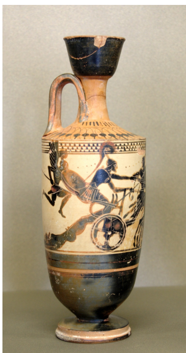
Ο Αχιλλέας σέρνει το σώμα του Έκτορα

Η κακοποίηση του σώματος του Έκτορα δε θα σταματήσει στο λόγχισμα των Αχαιών. Όπως τονίζει ο ποιητής ο Αχιλλέας άεικέα μήδετο ἔργα (395) για τον νεκρό αντίπαλό του. Αφιερώνει μάλιστα δέκα στίχους στα ἔργα αυτά (395-404): αφού του τρύπησε τα πόδια,