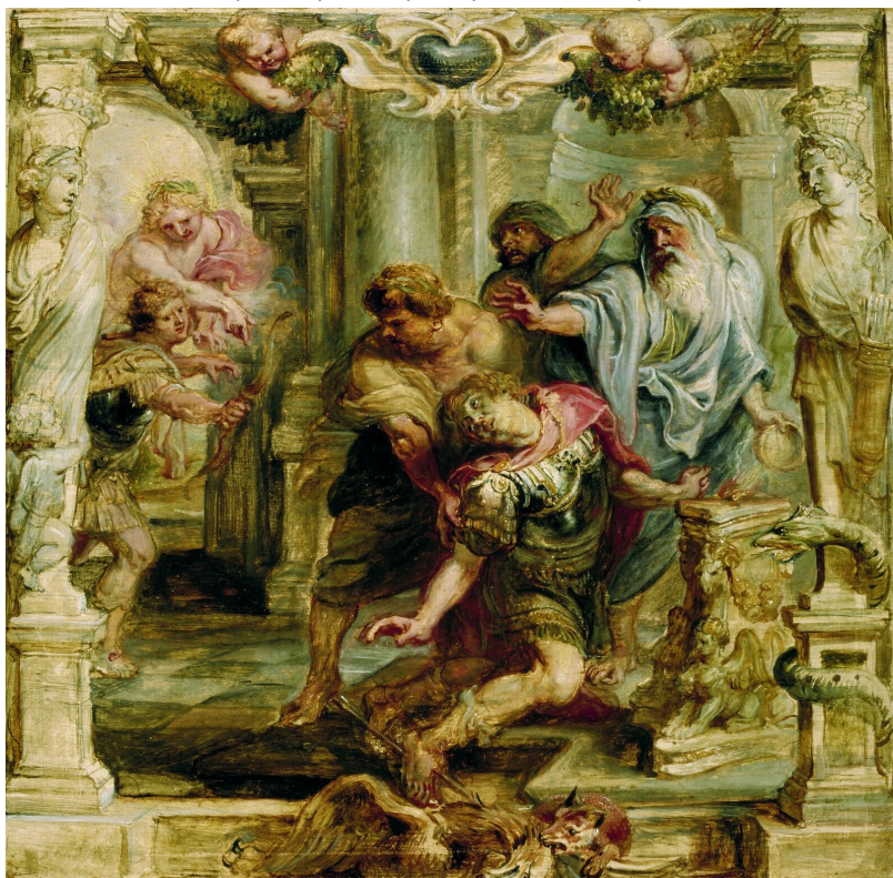
Ο θάνατος του Αχιλλέα, Peter Paul Rubens (1577- 1640)

Το χτύπημα του Αχιλλέα αποδεικνύεται καιρίο. Ο στίχος 327, που περιγράφει το χτύπημα του ακοντίου του Αχιλλέα, χρησιμοποιείται αυτούσιος για την περιγραφή του τρόπου με τον οποίο το βέλος του Οδυσσέα σκοτώνει τον Αντίνοο στην Οδύσσεια (χ 16). Λίγο πριν τον θάνατο του Έκτορα ακολουθεί ανταλλαγή λόγων (330-367) που θυμίζει έντονα την αντίστοιχη σκηνή του θανάτου του Πατρόκλου (Π 827-863) την οποία σαφώς ανακαλεί. Και στις δύο σκηνές οι νικητές (Έκτορας κι Αχιλλέας) καυχούνται για την επιτυχία τους. Και οι δύο απειλούν τον νεκρό ότι θα τον φάνε οι γύπες και οι σκύλοι, ενώ και στις δύο περιπτώσεις αυτοί που πρόκειται να πεθάνουν προφητεύουν το επερχόμενο τέλος των νικητών. Ο Έκτορας όμως αμφισβητεί την προφητεία του Πατρόκλου, ενώ ο Αχιλλέας