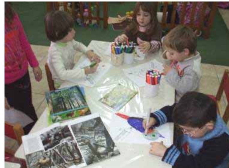
Ζωγραφίζουμε πουλάκια του δάσους (Εικαστικά)