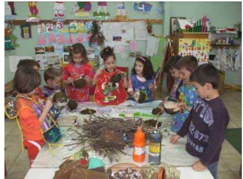
Κατασκευάσαμε χελώνες με άχρηστα υλικά (Εικαστικά)