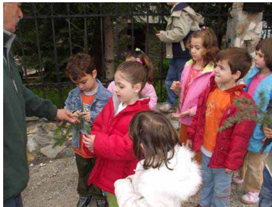
Επίσκεψη και ενημέρωση από δασολόγο της περιοχής (Μ. Περιβάλλοντος)