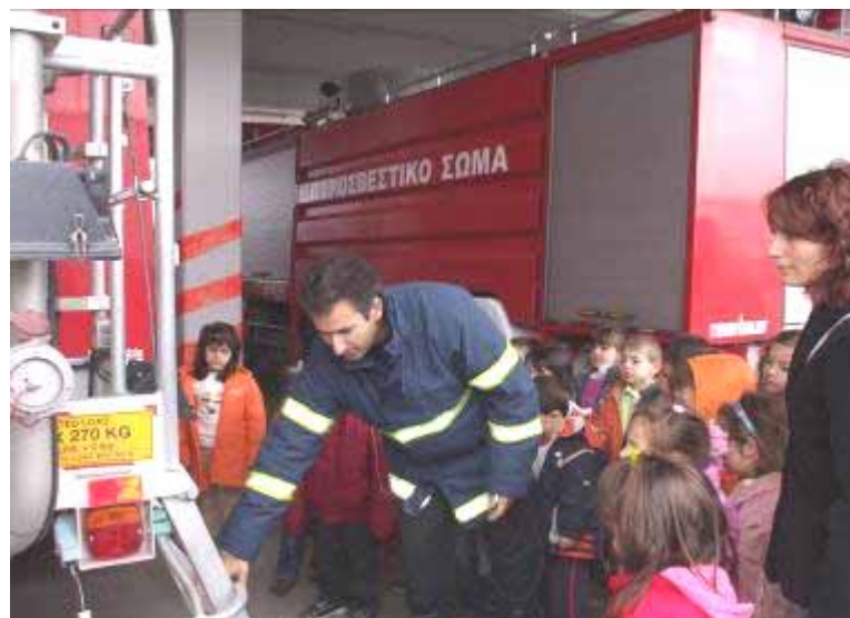
Η στολή του πυροσβέστη