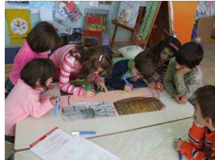
Ο κύκλος των εποχών (Μ. Περιβάλλοντος-Γραφή)