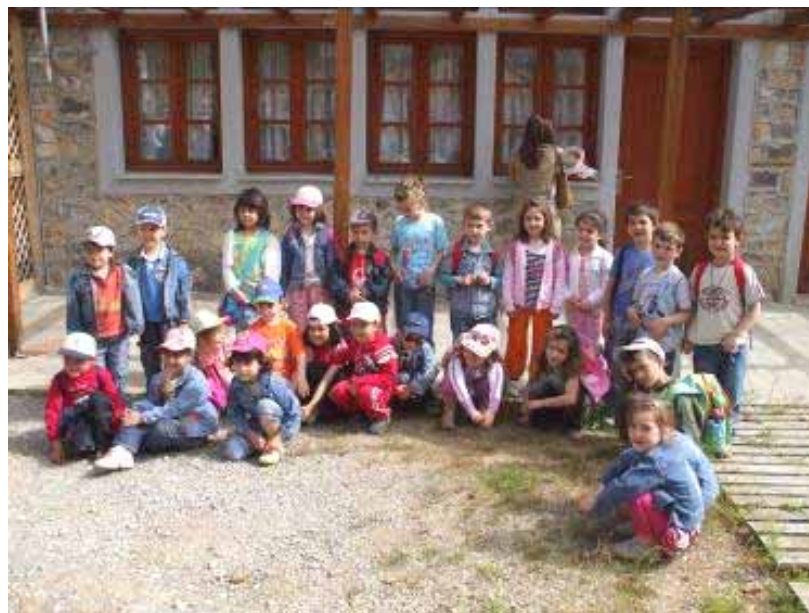
Από την επίσκεψη στο Κ.Π.Ε. Αν. Ολύμπου