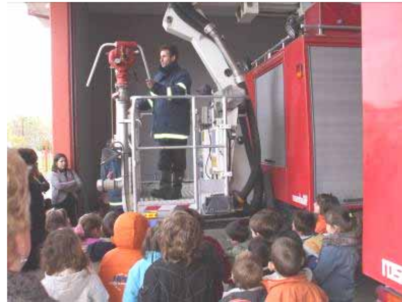
Επίσκεψη στην Πυροσβεστική Υπηρεσία (Μ. Περιβάλλοντος)