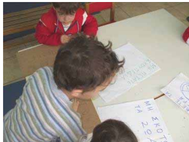
Πινακίδες με μηνύματα για την προστασία του δάσους (Γραφή- Μ. Περιβάλλοντος)