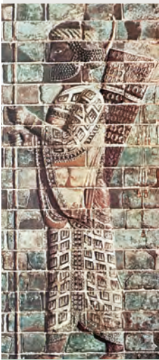
1. Στρατιώτης-τοξότης της φρουράς του Δαρείου

Οι ελληνικές πόλεις της Μ. Ασίας δεν είχαν κάνει δικό τους κράτος. Διαιρεμένες όπως ήταν έχασαν την ελευθερία τους και, προπάντων, δεν μπορούσαν να εμπορευτούν ελεύθερα με άλλες πόλεις του Εύξεινου Πόντου. Όταν μάλιστα οι Πέρσες έκαναν εκστρατεία στη Θράκη, ανά-