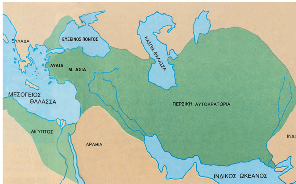
2. Η Περσική αυτοκρατορία