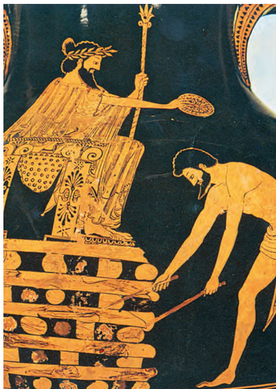
6. Ο Κροίσος πάνω στη φωτιά, παράσταση σε αγγείο. (Μουσείο Λούβρου)

Οι Πέρσες κυρίεψαν τις Σάρδεις και αιχμαλώτισαν τον Κροίσο, που βασίλεψε 14 χρόνια και πολιορκήθηκε 14 μέρες. Οι Πέρσες, αφού έπιασαν τον Κροίσο, τον έφεραν μπροστά στον Κύρο. Αυτός έδωσε διαταγή να ανάψουν μια μεγάλη φωτιά και να τον ανεβάσουν επάνω μαζί με 14 νεαρούς Λυδούς, για να θυσιαστούν σε κάποιον θεό. Κι ενώ ο Κροίσος βρισκόταν πάνω στη φωτιά, θυμήθηκε τον Σόλωνα, που του είχε πει πως κανένας άνθρωπος δεν είναι απόλυτα ευτυχισμένος. Τότε αναστέναξε και φώναξε τρεις φορές: «Σόλωνα, Σόλωνα, Σόλωνα». Ο Κύρος παραξενεύτηκε και ζήτησε εξηγήσεις. Ο Κροίσος διηγήθηκε στον Κύρο πως τα πρώτα χρόνια της βασιλείας του τον είχε επισκεφτεί ένας Αθηναίος, ο Σόλωνας, που είχε περιφρονήσει τα πλούτη του και του είχε πει πολλά που τώρα βγήκαν αληθινά. Ο Κύρος, μόλις άκουσε αυτά, φοβήθηκε μήπως κάποτε τιμωρηθεί κι αυτός από τους θεούς γι' αυτή του την πράξη. Έδωσε λοιπόν διαταγή να σβήσουν τη φωτιά και να κατεβάσουν τον Κροίσο και τους συντρόφους του.