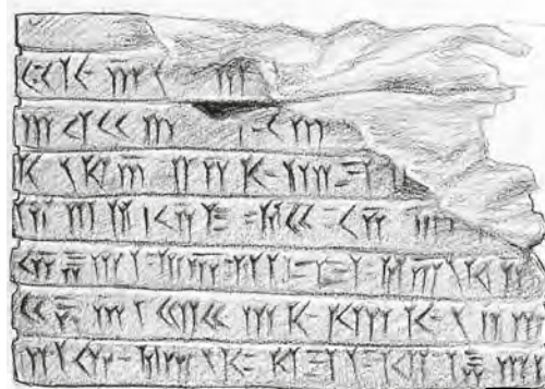
7. Επιγραφή σε σφηνοειδή γραφή στην Περσέπολη

Ξενοφώντας, Κύρου Παιδεία, 2, 6 (διασκευή)