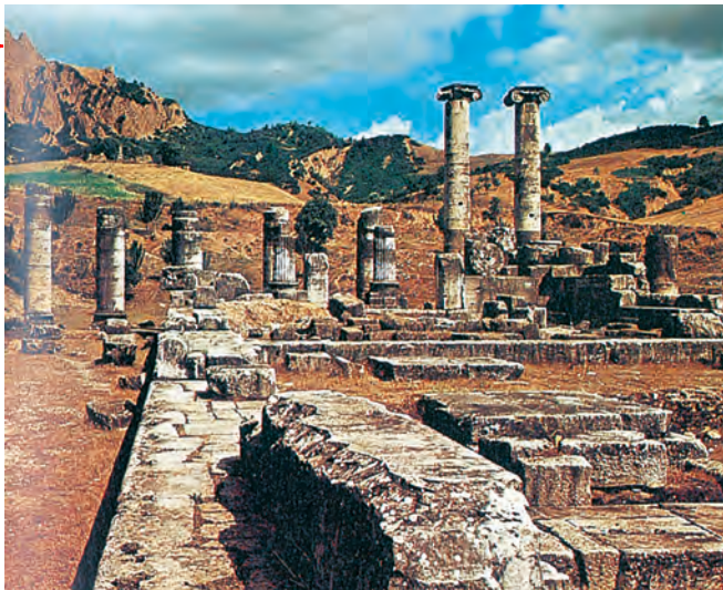
5. Ερείπια από τις Σάρδεις