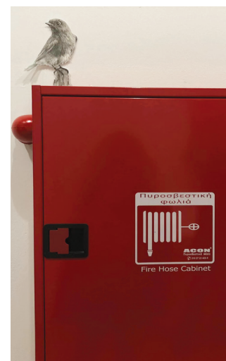
Ισμήνη Μπονάτσου, «Πυροσβεστική φωλιά» 2024, (έργο in situ)