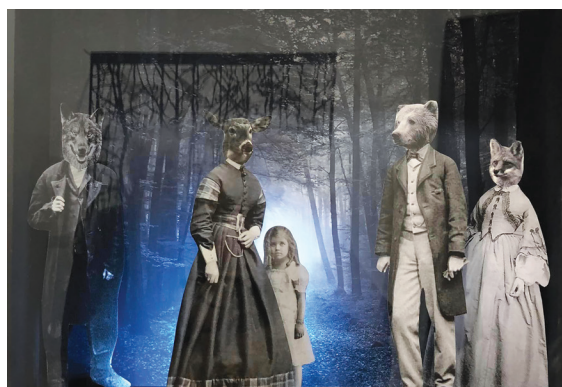
Έλενα Αντωνοπούλου, «Συνύπαρξη» 2021, (κατασκευή – φωτογραφία)