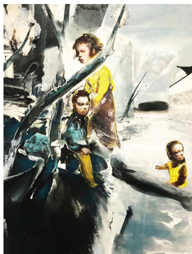
Τάσος Μισούρας, «The Reformist» 2016, (ακρυλικά και λάδι σε καμβά)