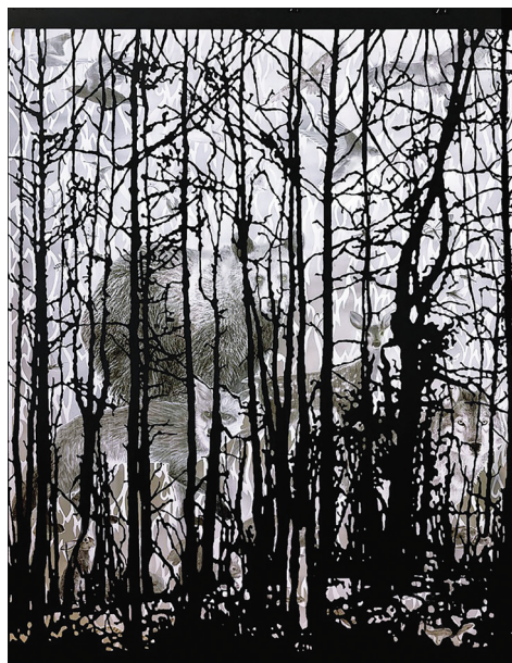
Ισμήνη Μπονάτσου, «Οι αθώοι» 2022, (μολύβι, κάρβουνο, κοπτική σε χαρτί)

Παραθέτουμε εδώ μερικά από τα έργα της έκθεσης.