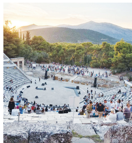
Το θέατρο της Επιδαύρου και το ειδικό φυσικό περιβάλλον του

Ο σημαντικότερος αρχαίος τόπος λατρείας του θεού Ασκληπιού ήταν η Επίδαυρος. Το σωζόμενο σήμερα περίφημο αρχαίο θέατρο βρίσκεται μέσα σε ειδικό τοπίο, θαυμαστό πευκοδάσος, χώρος που φανερώνει σε όλο του το μεγαλείο την αγάπη για το φυσικό περιβάλλον, που ο σύγχρονος άνθρωπος έχει απεμπολήσει και κάθε καλοκαίρι βλέπουμε να γίνονται ολοκαύτωμα τα λίγα εναπομείναντα δάση της χώρας!