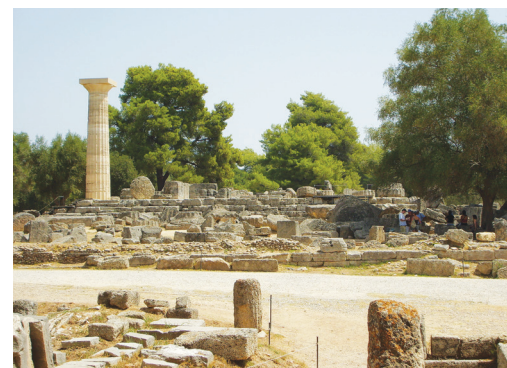
Το Ιερό του Διός στην αρχαία Ολυμπία

Η Ιερά Άλτις, δηλαδή Ιερό Άλσος, στην αρχαία Ολυμπία είναι από τους ωραιότερους κατάφυτους χώρους δίπλα στην όχθη του ποταμού Αλφειού. Σημειώτενο ότι κάθε ποταμός για τους αρχαίους Έλληνες ήταν μια θεότητα, ένα ακόμα στοιχείο του απόλυτου σεβασμού και της λατρείας προς τη φύση.