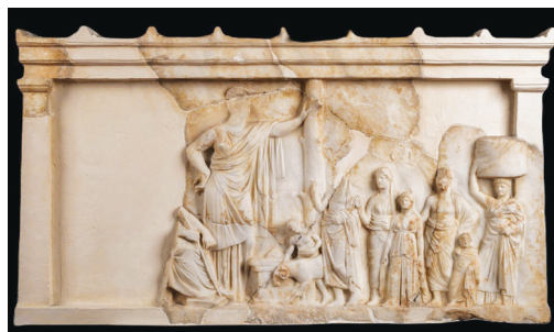
Η φύση σε ανάγλυφο από το Ασκληπιείο της Ακρόπολης

Εκτός από χώροι λατρείας, τα αρχαία ελληνικά ιερά ήταν προστατευμένα οικοσυστήματα. Τα δέντρα συνέτειναν στη δημιουργία ενός δροσερού περιβάλλοντος που προσφερόταν για πνευματική ενατένιση και προσευχή. Ειδικό αξιωματούχοι στα ιερά φρόντιζαν για την προστασία του περιβάλλοντος και επέβαλλαν πρόστιμα σε τυχόν παραβάτες, όπως στην Κω, όπου για τυχόν κοπή των κυπαρισσιών του τεμένους του Απόλλωνα Κυπαρισσίου και του Ασκληπιού το πρόστιμο ήταν 1000 δραχμές. Τα δέντρα και οι πηγές στα όρια του τεμένους, δηλαδή εντός του περιβόλου των ιερών, θεωρούνταν ιδιοκτησία των θεών και ιεροί νόμοι τα προστάτευαν στο όνομά τους. Κάποιες φορές οι θεοί απεικονίζονται κοντά στα δέντρα τους. Στο ανάγλυφο από το Ασκληπιείο της Νότιας Κλιτύς της Ακρόπολης η θεά Υγεία ακουμπά νωχελικά πάνω στον κορμό ενός δέντρου χωρίς κλαδιά. Αριστερά της σώζεται τμήμα της μορφής του καθήμενου Ασκληπιού, ενώ στα δεξιά ομάδα λατρευτών προσέρχονται για θυσία και μια θεραπευαίνιδα κουβαλά στο κεφάλι ένα καλάθι με προσφορές.