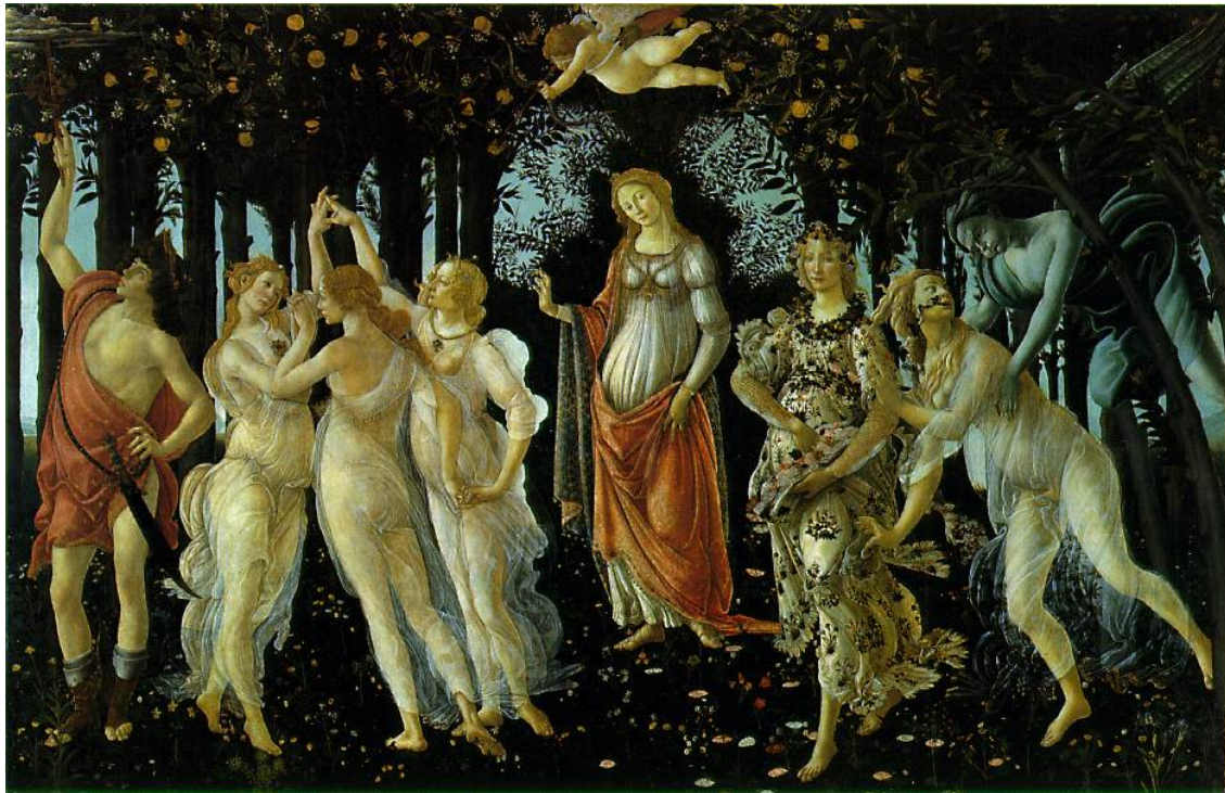
Ο θρίαμβος της Άνοιξης

Η φύση στη ζωγραφική του αναγεννησιακού ιταλού ζωγράφου Μποτιτσέλι παίζει πρωταρχικό ρόλο με έντονα φιλοσοφημένη διάθεση. Οι πίνακες «Ο θρίαμβος της Άνοιξης» και «Αναδυομένη Αφροδίτη» έχουν έμπνευση από την αρχαία ελληνική μυθολογία: συναντάμε Νύμφες, Χάριτες, θεούς του δωδεκάθεου (Ερμής, Αφροδίτη), το μικρό θεό Έρωτα και στον πρώτο πίνακα ίσως το μυθολογικό κήπο των Εσπερίδων.