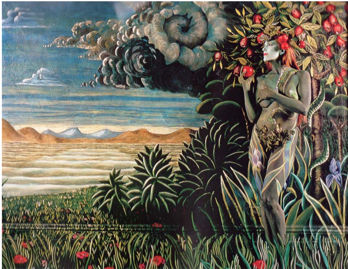
Σεπτέμβριος, Η Εύα και το απαγορευμένο μήλο, έμπνευση: Ουτσέλλο, Ρουσσώ, Λούκας Κράναχ