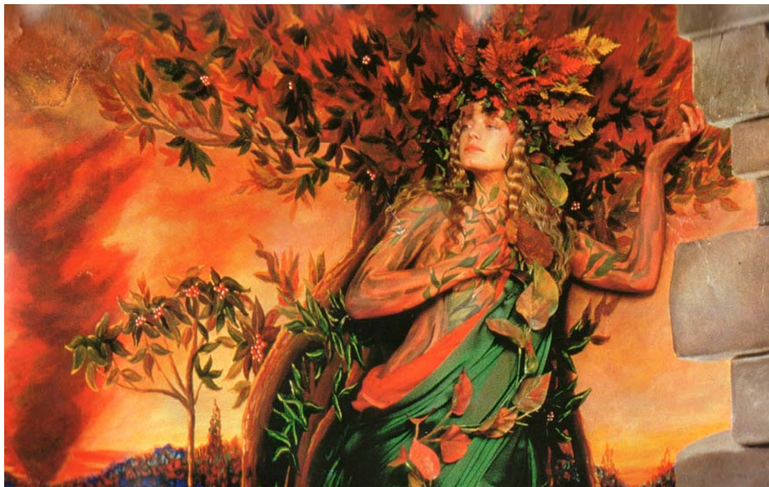
Οκτώβριος, Η μεταμόρφωση της Δάφνης σε δέντρο, για να ξεφύγει από τον Απόλλωνα, έμπνευση: Προ-Ραφαηλίτες