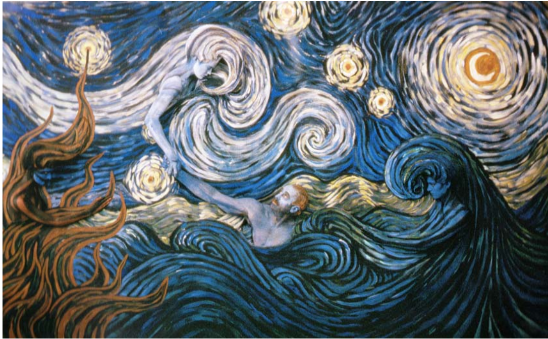
Μάρτιος, Βασιλιάς Ληρ “Τρελός σαν τη φουρτουνιασμένη θάλασσα”, έμπνευση: Βαν Γκογκ και Βασιλιάς Ληρ