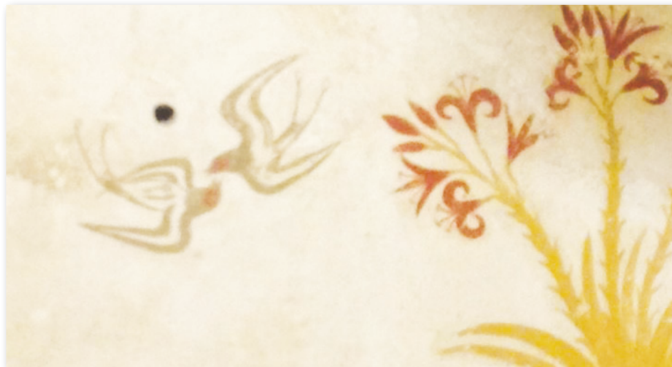
Χελιδόνια, από την τοιχογραφία της Άνοιξης, πρωτοκυκλαδική τέχνη.

Ο Νικόλαος Γύζης, ένας από τους πιο σημαντικούς Έλληνες ζωγράφους της λεγόμενης «Σχολής του Μονάχου», δηλαδή του συντηρητικού εικαστικού κινήματος του ακαδημαϊκού ρεαλισμού κατά τα τέλη του 19 ου αιώνα, σε κάποιους πίνακές του με ιδεαλιστικά - αλληγορικά θέματα, δίνει μια εξπρεσιονιστική τάση απελευθέρωσης από τον ακαδημαϊκό ρεαλισμό. Στον ιδεαλιστικής θεματολογίας πίνακά του «Εαρινή συμφωνία», πάνω από το λουλουδιασμένο έδαφος χελιδόνια πετούν και μια ορχήστρα από ανήλικες αγγελικές γυναικείες φιγούρες γεμίζουν μουσική τον χώρο, ενώ μια αγγελική παιδική χορωδία φαίνεται ως να βγαίνει από ένα διάχυτο φως που καταυγάζει τον ουρανό. Και σε άλλους τέτοιους πίνακες του Γύζη η σημαντικότερη αλληγορική μορφή είναι η γυναικεία φιγούρα με ιδεαλιστικό χαρακτήρα που συνήθως κρατά μια λύρα. Εμφανίζεται στα έργα του με τα ονόματα Τέχνη, Μουσική, Άνοιξη, Αρμονία, Ιστορία κ.α. Εδώ, στον παραπάνω πίνακα, κατά κάποιον τρόπο, οι γυναικείες μορφές συνδυάζουν τους συμβολισμούς της Άνοιξης, της Μουσικής, της Αρμονίας και, τελικά, της Τέχνης, αφού δένονται σε ένα σύνολο αρμονικά τα στοιχεία της μουσικής σε ανοιξιότατο έργο τέχνης δημιουργώντας μια συμφωνία φωτός και χρωμάτων...!