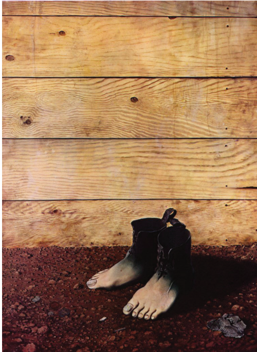
Magritte, "Κόκκινο μοντέλο"