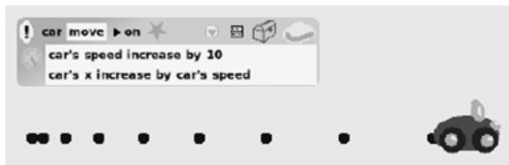
Εικόνα 2. Μελέτη της ομαλά επιταχυνόμενης κίνησης με το Squeak Etoys. Στην εικόνα φαίνεται και το αντίστοιχο script.

Πολύ εύκολα, με την κατάλληλη καθοδήγηση (Ορφανός & Δημητρακοπούλου, 2005), οι μαθητές μπορούν να αρχίσουν να μελετούν την ευθύγραμμη ομαλή κίνηση και την ομαλά επιταχυνόμενη κίνηση (Kay, χ.χ.). Επίσης, εμπλουτίζοντας τις αναπαραστάσεις των φαινομένων που μελετούν, οι μαθητές μπορούν να δημιουργήσουν γραφικές παραστάσεις των κινήσεων.