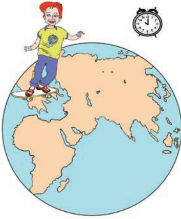
Εικόνα 1.2α: Η ώρα είναι 10:00 π.μ.

Η Γη κινείται επίσης και γύρω από τον Ήλιο. Η κίνησή της αυτή λέγεται περιφορά .