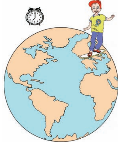
Εικόνα 1.2γ: Η ώρα είναι 7:00 μ.μ.

Η περιφορά της Γης γύρω από τον Ήλιο διαρκεί 365 ημέρες και 6 ώρες, δηλαδή 1 έτος και 6 ώρες.