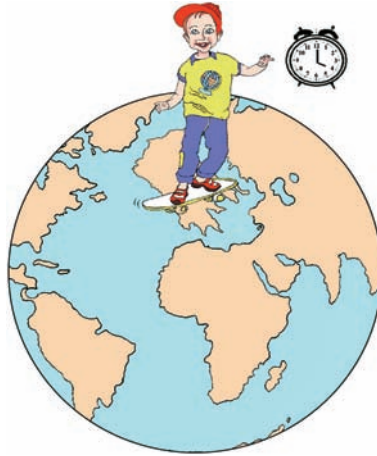
Εικόνα 1.2β: Η ώρα είναι 4:00 μ.μ.