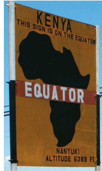
Εικόνα 2.3ε: Κένυα