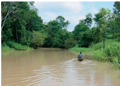
Εικόνα 2.3γ: Αμαζόνιος