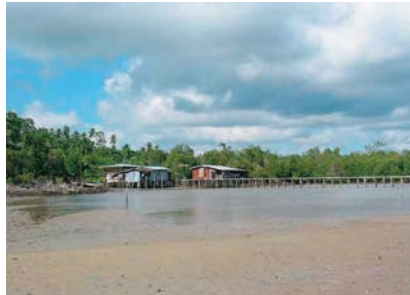
Εικόνα 2.3β: Βόρνεο