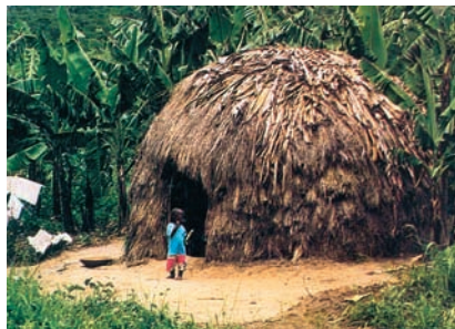
Εικόνα 2.3δ: Ουγκάντα