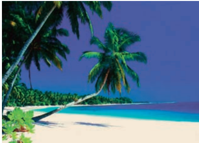
Εικόνα 2.3α: Ινδονησία

Βρείτε στην υδρόγειο σφαίρα τον Ισημερινό. Ταξιδέψτε κατά μήκος του και ονομάστε τις χώρες που θα συναντήσετε.