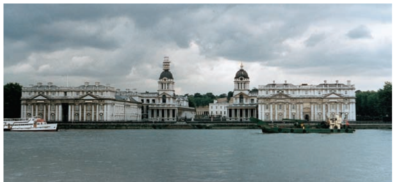
Εικόνα 2.4: Γκρίνουιτς, Λονδίνο