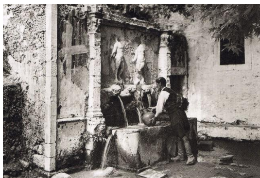
Ζαρός, Μονή Βροντησίου.

Ο Σεφέρης αντίκρουσε την Ελλάδα με ιδέα κι όραμα. Δεν προσπάθησε να αποδώσει τα στοιχεία της ελληνικής φύσης μέσα από υποβλητικές εικόνες, μορφολατρικές και μεγαλόσχημες. Στα ταπεινά κι αληθινά της αναζήτησε την πατρίδα του : στη φύση της, στις ευωδιές της, στους ήχους της, στους αγώνες και τις μνήμες των απλών ανθρώπων, αλλά κυρίως στο υγρό στοιχείο. Μέσα από αυτό κατάφερε να κατακτήσει την ουσία του τόπου, φτάνοντάς τον στο ιδεατό του ύψος αποδίδοντας μ' αυτό τον τρόπο και την έννοια της «ελληνικότητας» 4 .