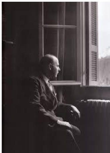
Ο Σεφέρης στη Βίλα «Γαλήνη».

Βγήκα στη βεράντα κατά τη θάλασσα, η ώρα ήταν πια 08.30, ο ήλιος ψηλά. Αδύνατο να ξεχωρίσεις το φως από τη σιωπή, τη σιωπή και το φως από τη γαλήνη. Κάποτε η ακοή άγγιζε έναν κρότο, μια μακρινή φωνή, ένα ψηλό τιτίβισμα. Όμως αυτά ήταν με κάποιο τρόπο κλεισμένα αλλού, όπως το χτύπημα της καρδιάς σου που ένιωθες μια στιγμή κι έπειτα το ξεχνούσες. Η θάλασσα δεν είχε επιφάνεια, μόνο οι αντικρινοί λόφοι δεν τέλειωναν στη γραμμή της γης, αλλά τραβούσαν πέρα κάτω, ξαναρχίζοντας μια πιο θαμπή εικόνα της μορφής τους που έσβηνε απαλά στο βάθος ενός κενού. Αίσθημα πως υπάρχει μια άλλη πρόσοψη της ζωής. (Γράφω δύσκολα, προσπαθώντας να αποφύγω γενικές λέξεις, προσπαθώντας να περιγράψω αυτό το απερίγραπτο). Την επιφάνεια την καταλάβαινες κοιτάζοντας μακριά τα κουπιά, όταν βουτούσαν με μια στεγνή αναλαμπή, όπως σπάζει ένα τζάμι στον ήλιο, ή ακόμα - αργότερα- όταν πέρασε κάτω απ' το σπίτι μια βάρκα με ανεβασμένα και άδεια πανιά, καθρεφτισμένα απόλυτα μέσα στο νερό, σαν εικόνα σε τραπουλόχαρτο. Αίσθημα πως αν ανοίξει μια ελάχιστη χαραμάδα σ' αυτό το κλειστό όραμα, όλα μπορεί ν' αδειάσουν από τα τέσσερα σημεία του ορίζοντα και να σ' αφήσουν γυμνό και μόνο, γυρεύοντας ελεημοσύνη, τραυλίζοντας λόγια χωρίς ακρίβεια...»