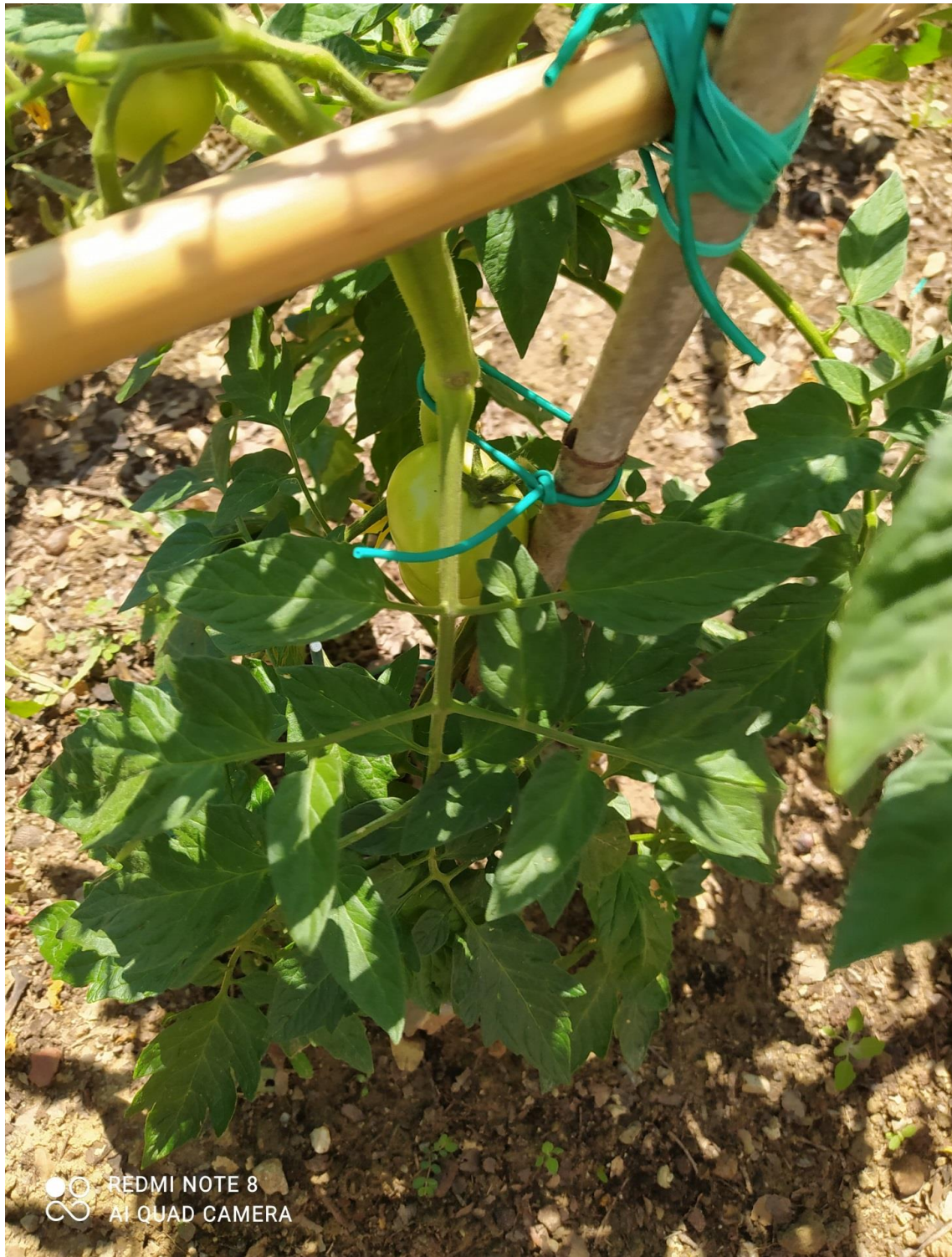
Ντοματιά με χρήση λιπάσματος κι παρουσία 2 ντομάτων