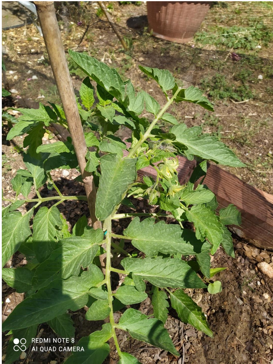
Ντοματιά χωρίς λίπασμα με άνθος , όχι ντομάτα ακόμη