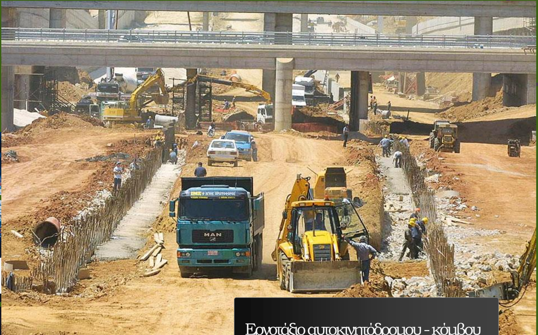
Εργοτάξιο αυτοκινητόδρομου - κόμβου