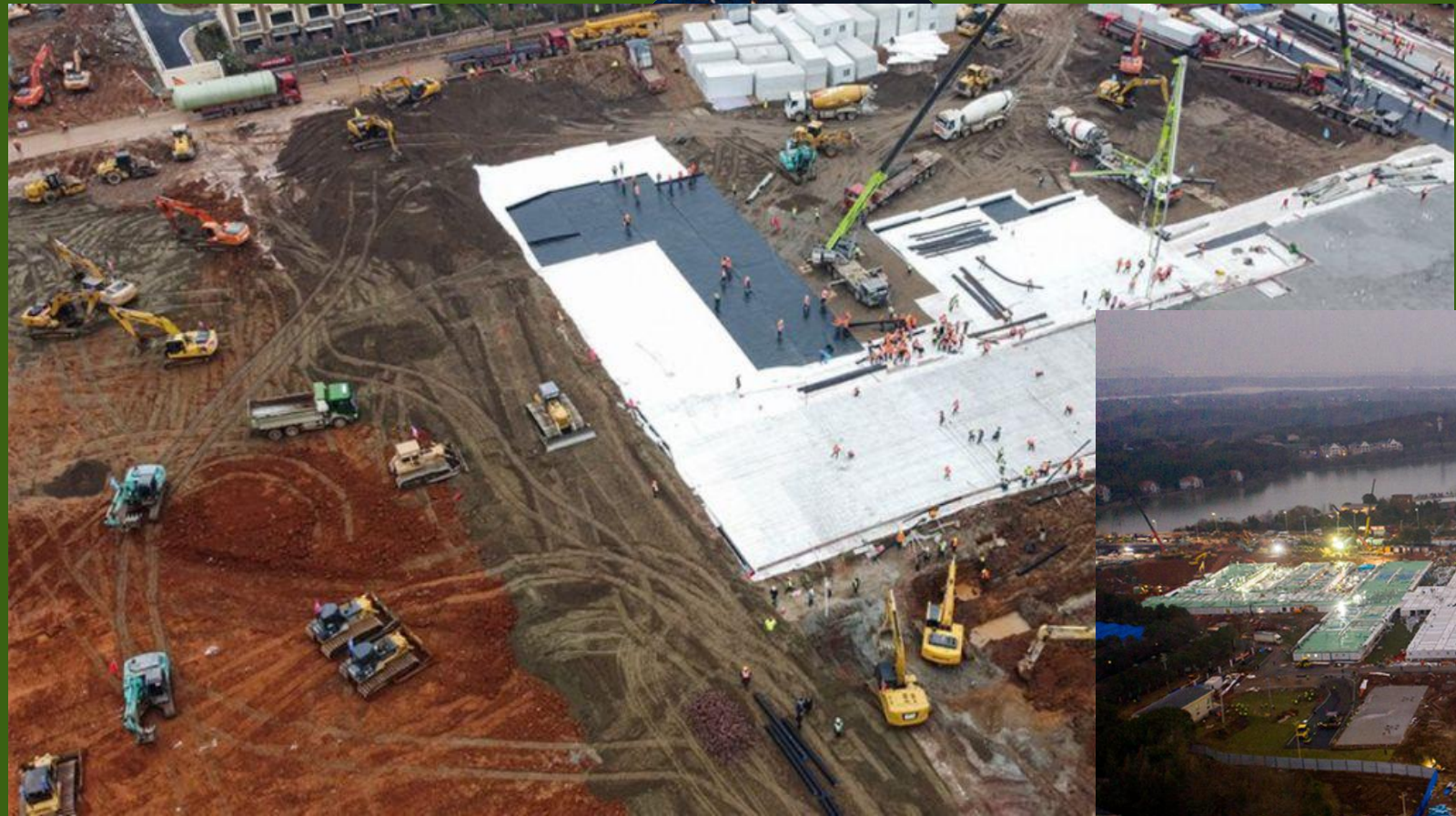
Εργοτάξιο νοσοκομείου στην Κίνα