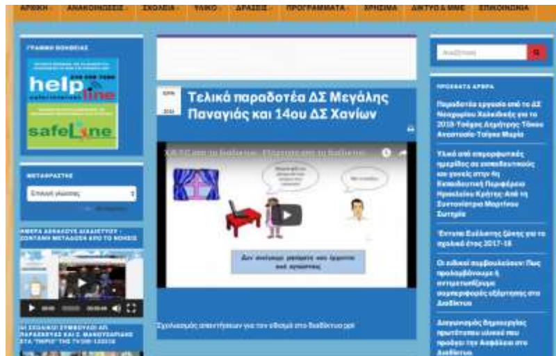
Εικόνα 2: Ιστοσελίδα του Θεματικού Δικτύου Ασφάλεια στο Διαδίκτυο- Παραδοτέα εργασία

Οι συνεργατικές δράσεις που μελετήθηκαν στην παρούσα έρευνα ήταν οι δράσεις των παρακάτω Δημοτικών Σχολείων: