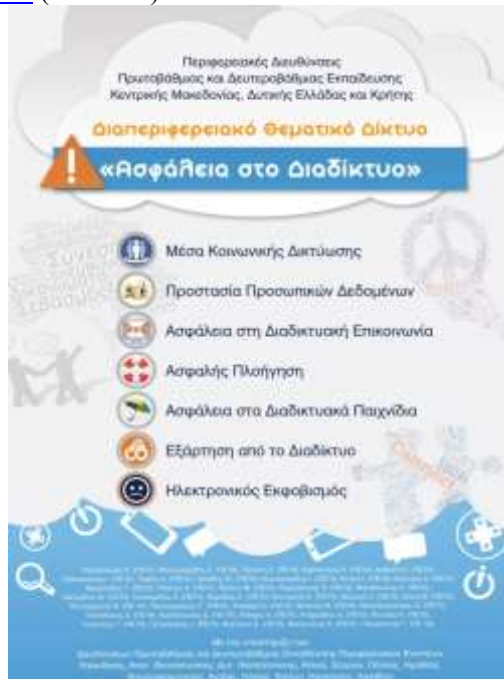
Εικόνα 1: Άξονες και συντονιστές του Διαπεριφερειακού Θεματικού Δικτύου

Μια σημαντική παράμετρος λειτουργίας του Δικτύου ήταν η παρότρυνση και η υποστήριξη προς τους εμπλεκόμενους εκπαιδευτικούς και μαθητές να ξεπεράσουν τα “όρια” της τάξης και να συνεργαστούν με τα υπόλοιπα συμμετέχοντα σχολεία του Δικτύου, ή το eTwinning, υλοποιώντας αυθεντικά έργα και παράγοντας κοινά παραδοτέα τα οποία αναρτήθηκαν στις ιστοσελίδες των σχολείων τους αλλά και στην ιστοσελίδα του Δικτύου, http://isecurenet.sch.gr/portal/ (εικόνα 2).