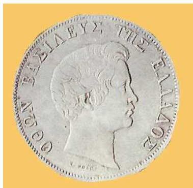
Τετράδραχμο, Αθήνα (5 ος π.χ. αιώνας)

Η δραχμή είναι η νομισματική μονάδα της Ελλάδας. Χρησιμοποιείτο από τα αρχαία χρόνια και σήμερα υποδιαιρείται σε 100 λεπτά. Στην αρχαιότητα ήταν ασημένιο νόμισμα. Επίσης στην αρχαιότητα από τη μια πλευρά είχε αποτυπωμένη την κεφαλή της Θεάς Αθηνάς και από την άλλη μια κουκουβάγια, ενώ σήμερα από τη μια πλευρά έχει την κεφαλή κάποιου Έλληνα ήρωα της ελληνικής επανάστασης και από την άλλη ένα καράβι και την ένδειξη «Ελληνική Δημοκρατία» καθώς και το έτος κοπής της. Η δραχμή αποτελεί τη βάση του νομισματικού μας συστήματος. Για τη διευκόλυνση όμως των συναλλαγών κόπηκαν και μεγαλύτερα νομίσματα από αυτήν αλλά μεταλλικά και άλλα χάρτινα. Έτσι έχουμε το τάλιρο (5 δρχ.), το δεκάρικο (10 δρχ.), το εικοσάρικο (20 δρχ.), το πενηντάρικο (50 δρχ.), το εκατοστάρικο (100 δρχ.) κτλ. Πολλαπλάσια της δραχμής υπήρχαν και στην αρχαιότητα σε μεταλλικά νομίσματα (τετράδραχμα, δεκάδραχμα, κτλ).