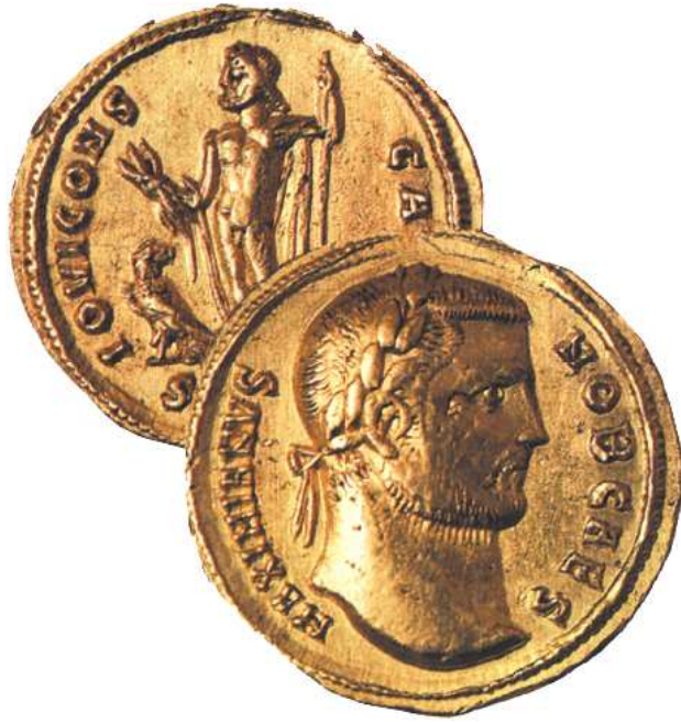
Χρυσά νομίσματα της εποχής του Μαξιμιανού