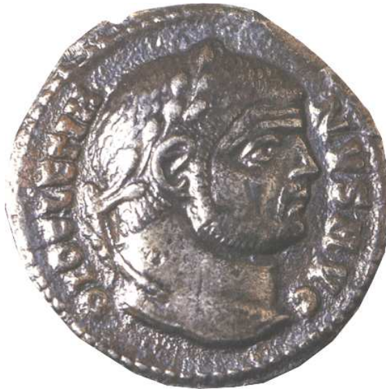
Αργυρό δηνάριο Διοκλητιανού (284 – 305 μ.Χ.)