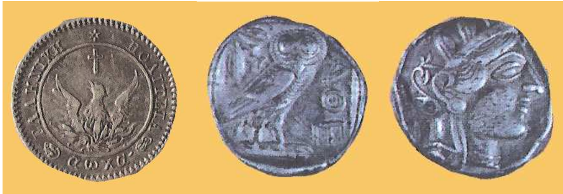
Νομίσματα της Ελληνικής Πολιτείας (1821)